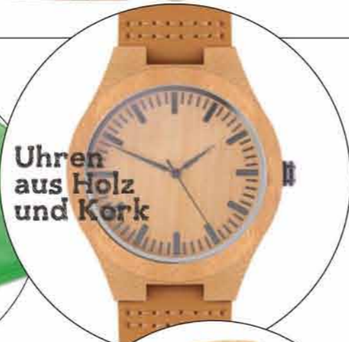
Uhren aus Holz und Kork