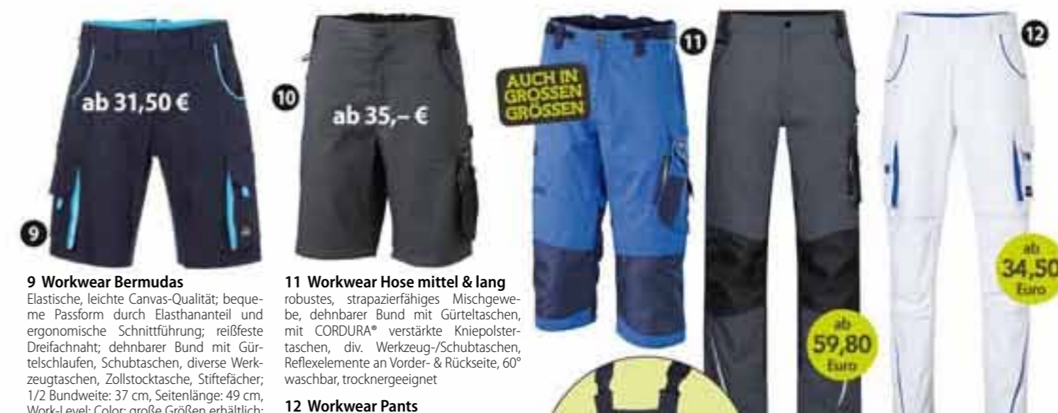
9 Workwear Bermudas

robustes, strapazierfähiges Softshellmaterial, wind- & wasserabweisend, atmungsaktiv, wasserdampfdurchlässig, viele Taschen, Reflexelemente am Arm/ Rückenteil, Oberstoff: 100% Polyester