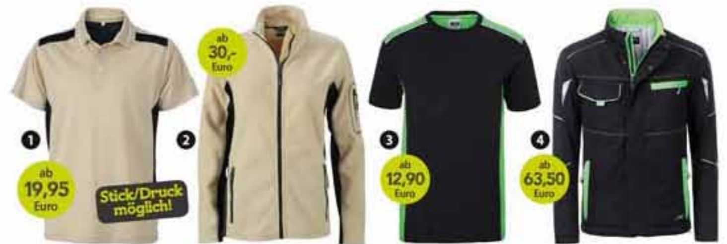
1 Workwear Polo

Mix aus Baumwolle/Polyester für optimale Form- und Waschbeständigkeit, gestrickter Polokragen und Armbündchen, 60° waschbar, trocknergeeignet, Oberstoff (200 g/m 2 ): 50% Polyester, 50% Baumwolle gekämmt