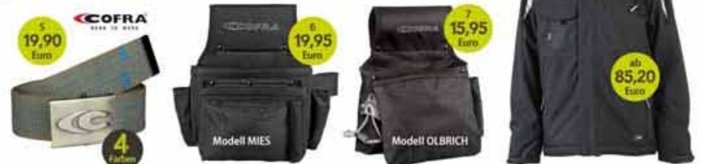
5 Gürtel „Patrasso“

Strapazierfähiger Gürtel aus 100% Polyester; individuell kürzbar und Weite stufenlos verstellbar; hochwertige Gürtelschnalle aus Metall mit Logoprägung; Farben: khaki, navy, anthrazit oder schwarz; Größen: 105/115/125/135/150 cm